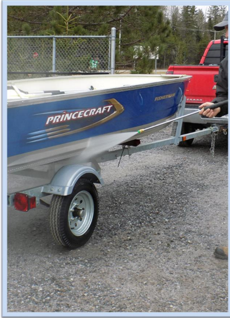
Lavage de bateau