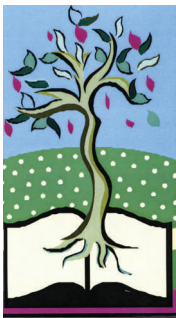
CFG des Cimes

Vincent Bernard , Coordonnateur de la maison des jeunes de Labelle