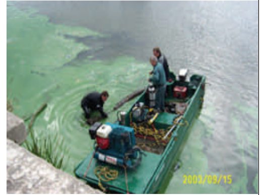
Fleur d'eau de cyanobactéries ayant l'apparence d'un déversement de peinture – Rivière Yamaska, septembre 2003, Robert Bolduc, municipalité de Saint-Hyacinthe

www.mddep.qc.ca/eau/eco_aqua/cyanobacteries/