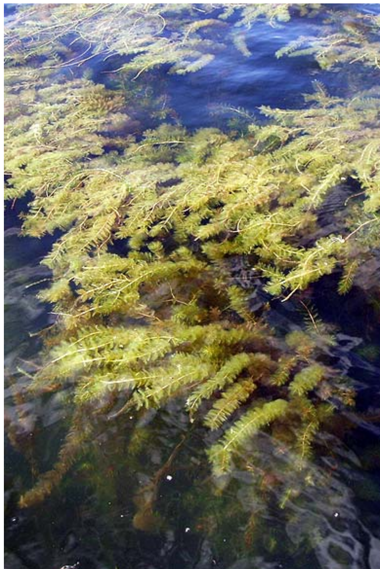
Myriophylle à épi