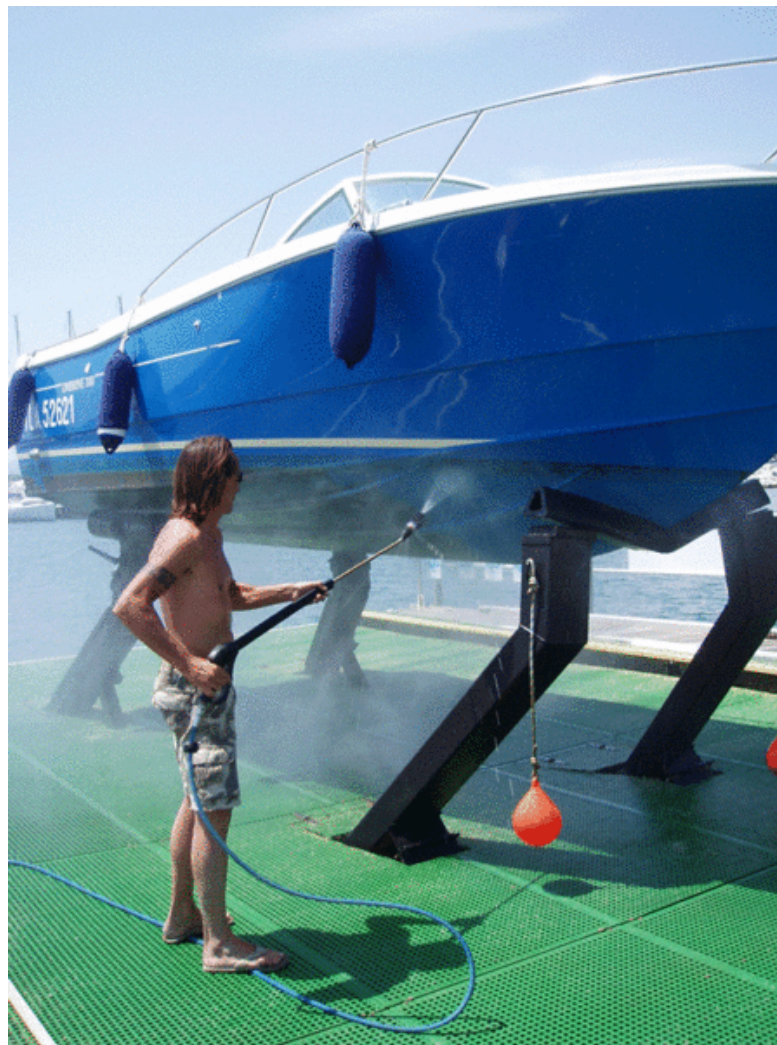
Lavage de bateau