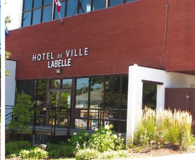
HOTEL DE VILLE LABELLE