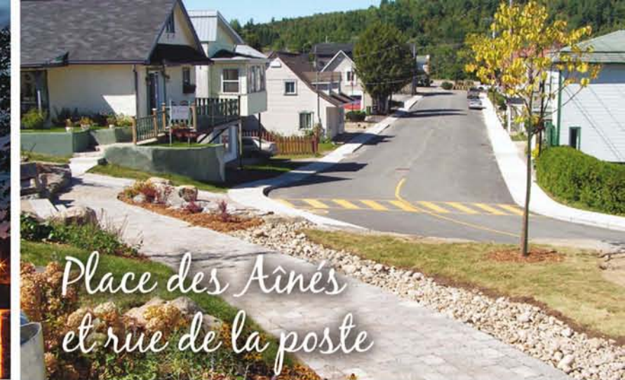
Place des Aînés et rue de la poste