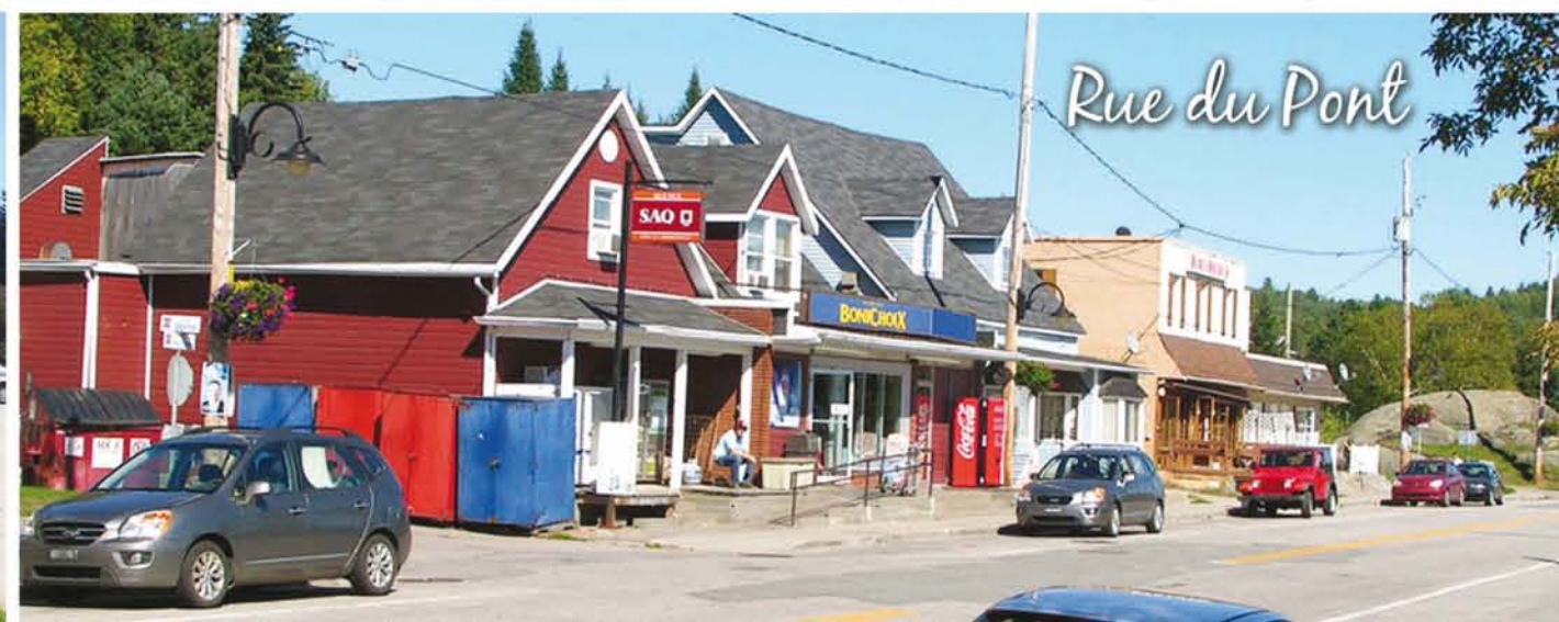
Rue du Pont