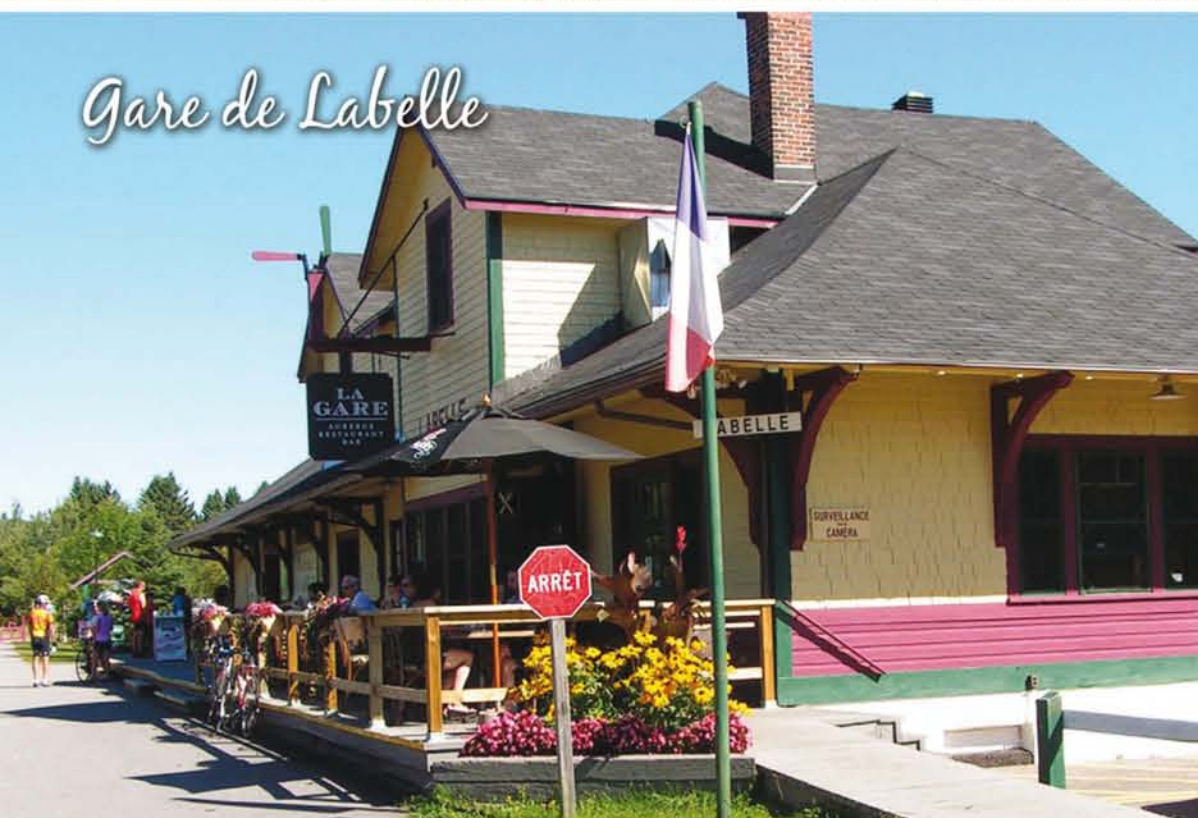
Gare de Labelle