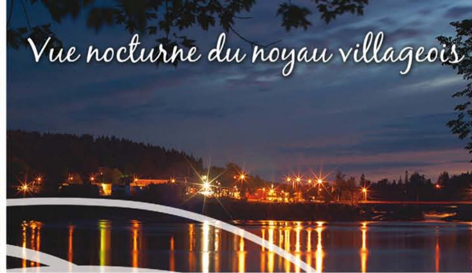
Vue nocturne du noyau villageois