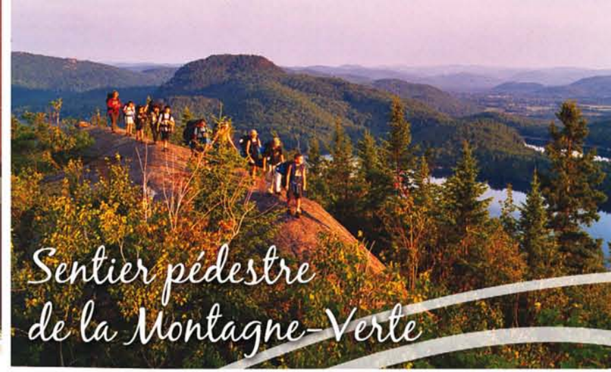
Sentier pédestre de la Montagne-Verte