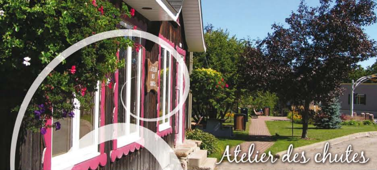
Atelier des chutes